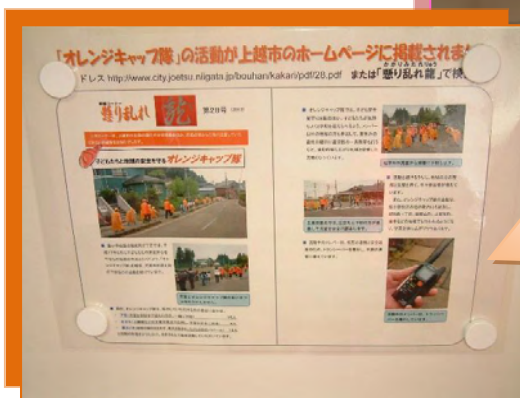
掲示されたオレンジキャップ隊の記事

「オレンジキャップ隊」の活動が懸り乱れ龍に掲載されると、昭和町2丁目の浜歯科医院では、記事をプリントアウトしたものを待合室に掲示して来院する皆さんに紹介するなど、「オレンジキャップ隊」の活動を地域全体で応援し、熱きエールをおくっています。