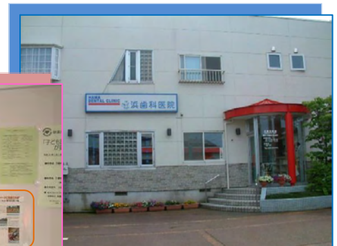
昭和町2丁目浜歯科医院