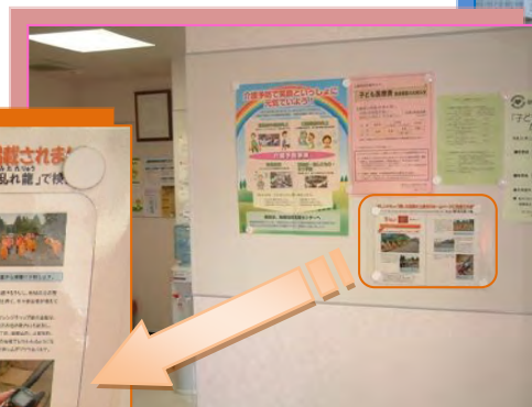
浜歯科医院の待合室