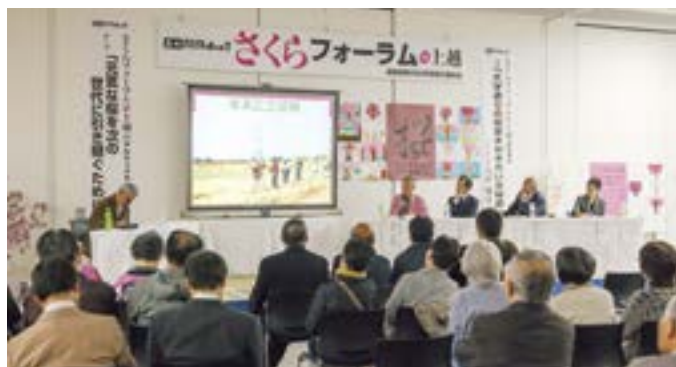
4/15 さくらフォーラム in 上越