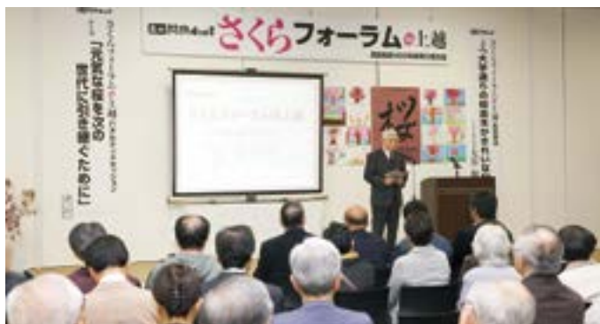
4/15 さくらフォーラム in 上越