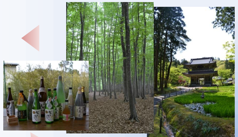
越五の国の魅力的な観光コンテンツ