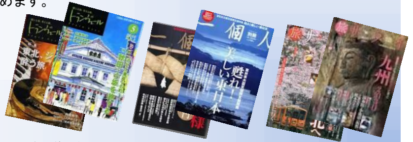
新幹線車内サービス誌 トランヴェール