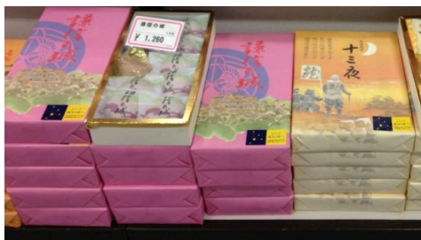
お土産にも「越五の国」シールを貼付（上越観光物産センターなど）