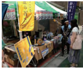
(PRブース「ネスパス入口手前」)

表参道・新潟館ネスパスにおいて、上越市農産物等販売促進実行委員会が実施する北陸新幹線開業に向けた「上越の食 試食&商談即売会」に併せて、PRを行いました。PRブースでは、お楽しみ抽選会も実施。 多くの方に北陸新幹線「上越妙高駅」開業と「越五の国」の魅力を伝えました。