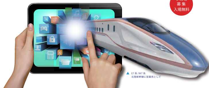
▲ E7系/W7系 北陸新幹線に営業用として