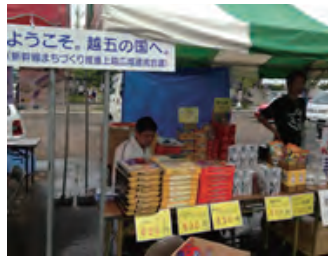
(㈱ニッカイ米山様ご出陣)

歌手のGACKT(ガクト)さんが2年ぶりに出演し、地域内外から20万人が参加した「第88回謙信公祭」。連携会議では「大物産 in 謙信公祭」に「ようこそ。越五の国へ。」PRブースを出展し、駅舎模型展示やぬり絵教室等を開催。その他、柏崎市から㈱ニッカイ米山様にご出陣いただき、お酒や米菓などの販売を行い、「越五の国」の物産をPRしていただきました。