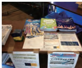
(イベントアイデア募集)

連携会議では、小木みなと公園のハーバーマーケットにおいて、「越五の国」PRブースを出展しました。 ブースでは「上越妙高駅」開業時のイベントアイデアも募集！！