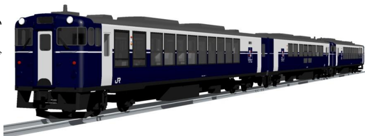
車両イラストはイメージです