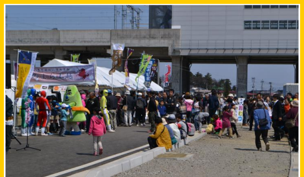
物販ブースや大抽選会など 大いに盛り上がりました

この日は、人文字の撮影のほか、越五の国の食が楽しめる「物販ブース」、グランクラスなどのチケットが当たる「大抽選会」、「ゆるキャラとだるまさんが転んだ」などのイベントも実施し、大盛況のうちに幕をとじました。