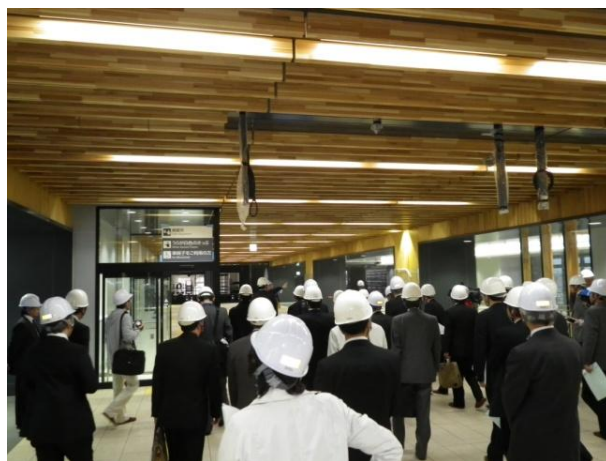
総会に向け加盟団体の代表による上越妙高駅の視察を実施。開業が間近であることを実感しました。