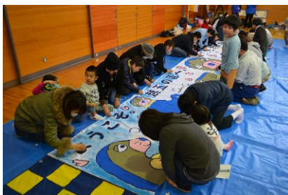
「上越妙高駅お出迎え隊」 ワークショップの活動のようす (H27.3.1)

新幹線・開業イベントPRサポーターの取組から誕生した 上越妙高駅お出迎え隊キャラクター「(仮称)もぐらくん」。 皆様からご協力をいただき、地域に愛され、全国に向けて 広く周知できるマスコットキャラクターを目指します！