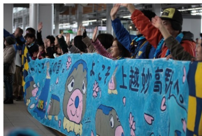
「上越妙高駅お出迎え隊」による お出迎えのようす (H27.3.14)