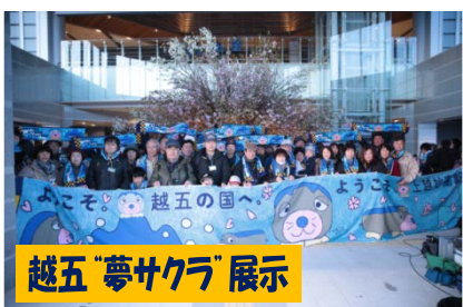
越五「夢サクラ」展示