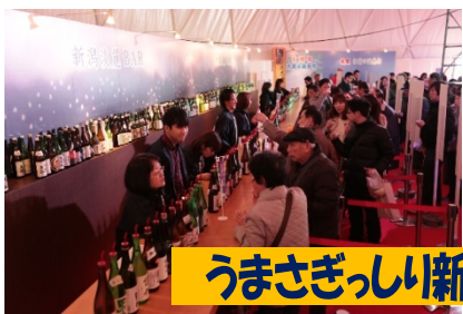
うまさぎっしり新潟in上越妙高駅

また、新幹線を利用して長野までの通勤・通学するなど、あらたなライフスタイルが生まれています。