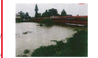
平成23年7月30日 集中豪雨で保倉川が増水し堤防を越えた流水と排水溝の逆流で付近民家で床下浸水が発生