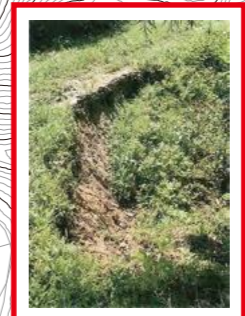
平成28年7月26日～27日 豪雨で3箇所土砂崩落