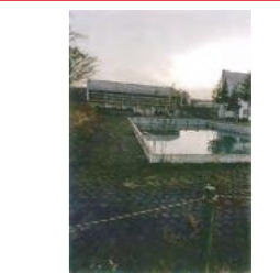
平成7年7月11日 豪雨で柴田池からの排水が溢れ小学校プールと体育館下に流出