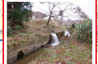
平成7年7月11日 豪雨で小学校脇からの排水溝と大瀧用水の合流箇所で堤防を越水し、里山地域活性化センター駐車場まで流出