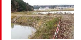
地震で柴田池の堤防が崩れると下流の民家で床下浸水するおそれあり