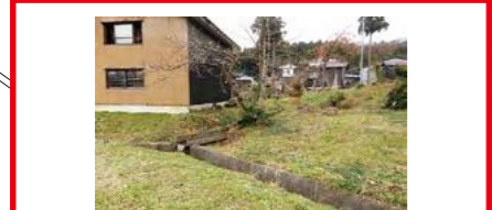
平成7年7月11日 山から大瀧用水につながる排水溝が豪雨で逆流して溢れ、近くの民家の床下付近まで流出