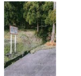
土石流危険溪流 関川・保倉川水系 西山沢 ※土砂災害のおそれあり注意！