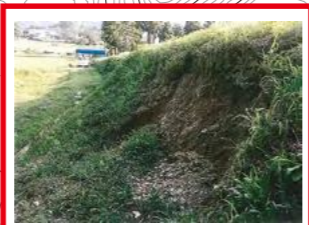
平成28年7月26日～27日 豪雨で土砂崩落