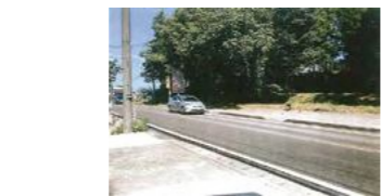
平成28年7月28日 豪雨の崖崩れで土砂が大瀧用水に流出し重機で排除、越水すると国道と民家が床下浸水するおそれあり

旧末広小学校 ※体育館が警戒区域内であることから、避難時は校舎を利用するよう注意が必要