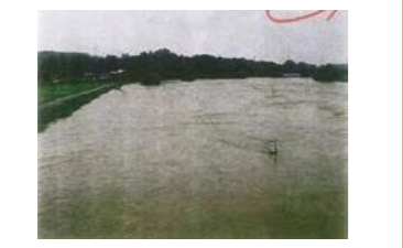
保倉川が増水し注意。水が堤防を越え付近一帯の水田が浸水したことがある