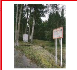
土石流危険溪流 関川・保倉川水系 朴ノ木沢 ※土砂災害のおそれあり注意！