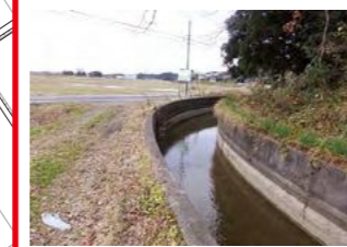
平成7年7月11日 豪雨で増水した大瀧用水カーブ箇所堤防を越水