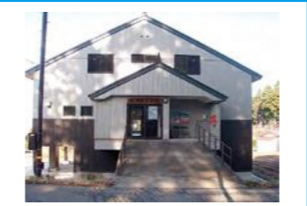
関田自治会館 ※警戒区域内のため速やかに 旧筒方小学校へ避難が必要