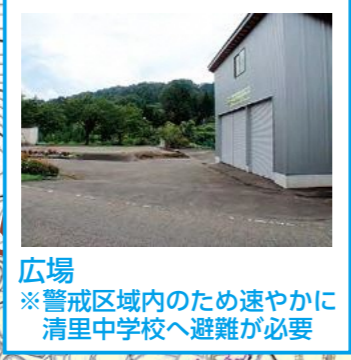
広場 ※警戒区域内のため速やかに清里中学校へ避難が必要