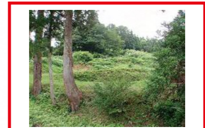
大雨時、水があふれるおそれあり