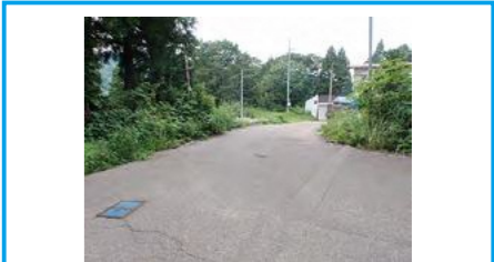
警戒区域の指定がない空白地 ※集落内で土砂災害が発生した場合の一時集合場所