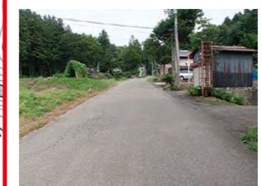
大雨時、水があふれるおそれあり