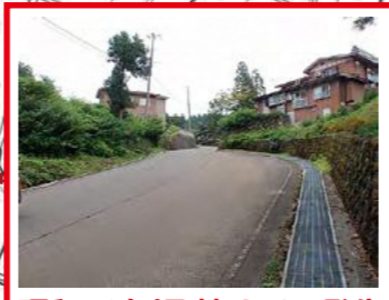
昭和50年頃 地すべり発生