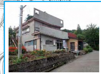
梨平集落開発センター ※警戒区域内のため速やかに清里中学校へ避難が必要