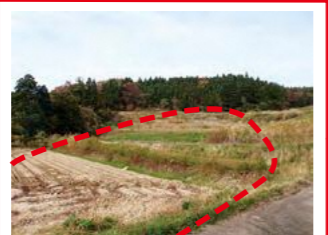
過去に地すべり発生