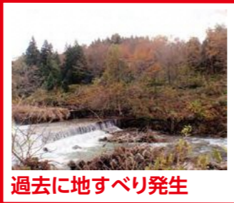
過去に地すべり発生