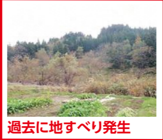
過去に地すべり発生