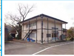
東戸野集会所 ※警戒区域内のため速やかに清里中学校へ避難が必要