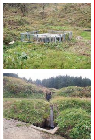
過去に地すべり発生