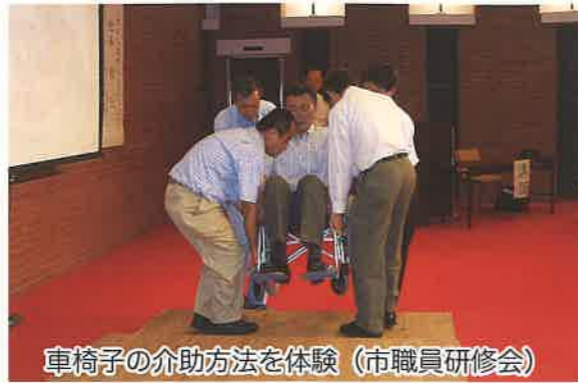
車椅子の介助方法を体験（市職員研修会）

私たちのまちには、様々な人が暮らしています。「ユニバーサルデザイン」は、障害の有無や性別、年齢、国籍などの違いにかかわらず、あらゆる人に使いやすい製品や建物、都市空間、サービス等の提供を目指そうという考え方です。