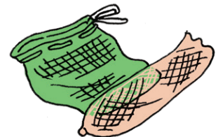
●野菜・果物のネット