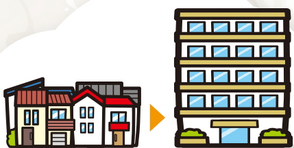
小さな敷地が集まり共同化