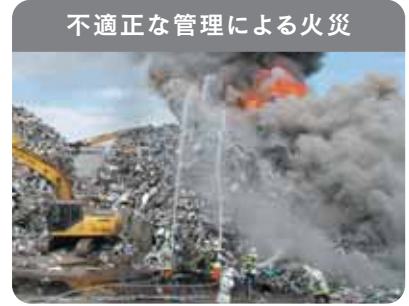
不適正な管理による火災

廃家電は電池やプラスチックを含むため、発火・延焼の危険性があり、不適正な管理による火災が発生しています。