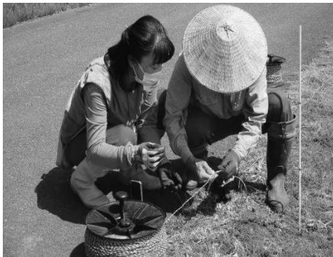
柿崎区東横山 電気柵設置作業

集落の行事や課題等に対応する人材が不足している中山間地域を市全体で支えるため、企業や団体等からボランティア協力していただく中山間地域支え隊（令和4年度末で市内の28の企業・団体、個人で11名が登録）を組織し、集落からの協力要請に応じて、行事や課題対応などに合計53回、延べ84団体・232人から参加いただいた。