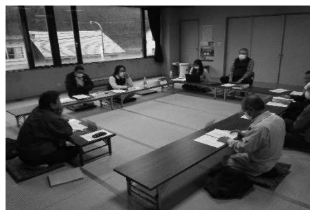
星の清里協同組合の総会