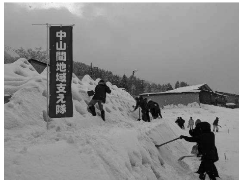
名立区不動 「灯の回廊」雪灯ろう等作製作業