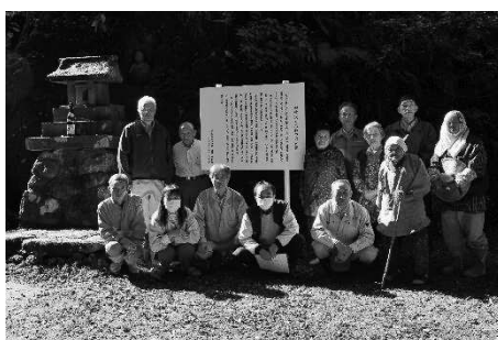
飯喰沢大名杜と石神像の保全活動（板倉区）