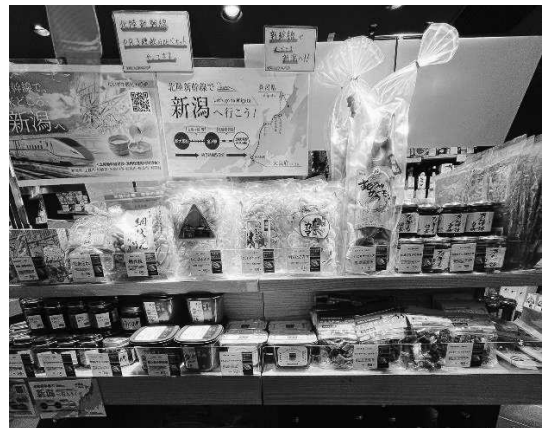
「新潟をこめ」でのPR活動