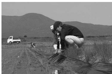
田植え作業を行う派遣職員

清里区の農業法人等が設立した「星の清里協同組合」の運営を支援するため、派遣職員人件費及び事業協同組合の事務局運営に要する経費の一部を支援した。