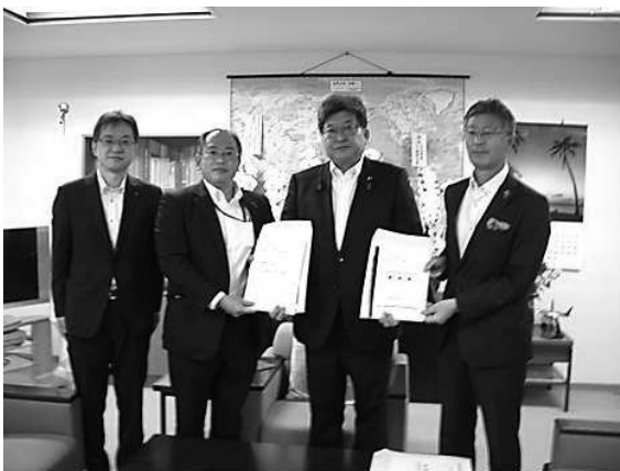
R4.8.24 北陸新幹線建設・活用促進期成同盟会 政府与党への要望