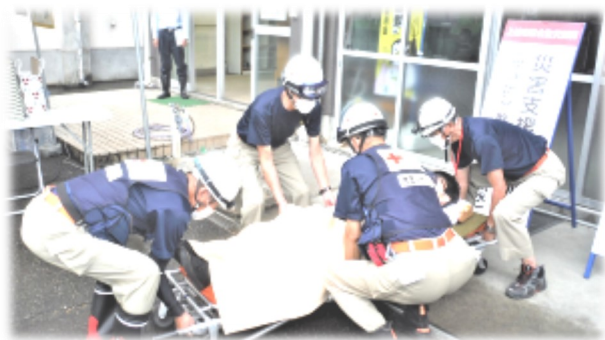
▲昨年度の総合防災訓練（谷浜地区）の様子

市民の防災意識を高めるため、10月15日⑥に中郷区を会場に上越市総合防災訓練を実施します。みんなで訓練に参加し、災害発生に備えましょう。訓練の詳細は、来月の総合事務所だよりでお知らせします。