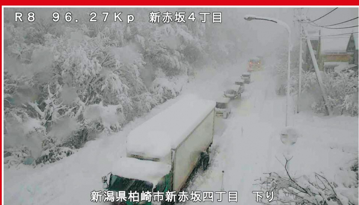
令和4年12月19日 国道8号(登坂不能車による交通障害の発生状況)