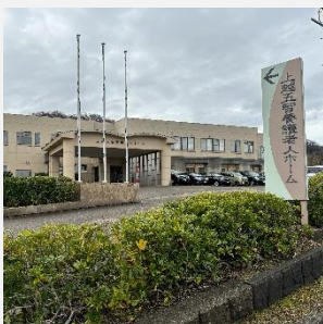
施設内の電話設備を改修

「上越市社会福祉施設整備基金」に積み立て、社会福祉施設整備のための資金として活用します。