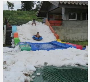
地域独自の予算で「真夏の雪山スブラッシュ」を開催（安塚区）

市内の各地域での住民の皆さんの活動を支える取組や、市内各所の資源を活用しながら地域の活力を高めていく取組など、多様な地域の特徴をいかしたまちづくりに関する取組に活用します。