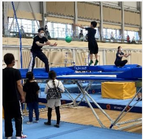
ジムリーナでのトランポリン教室（大潟区）

東京2020オリンピック・パラリンピックの開催を契機とした、ドイツとのスポーツ・文化交流の推進や機運醸成の取組のほか、その他スポーツ振興の取組に活用します。