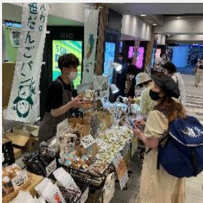
メイド・イン上越認証特産品PR

上越製品の販売力や発信力の底上げを図る取組のほか、その他産業振興の取組に活用します。