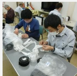
就労支援事業所での生産活動