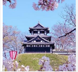
100年後も元気な桜を目指して市民活動を展開

「日本三大夜桜」の一つと称される高田城址公園の桜の保全活動や、公園全体の整備、景観形成による魅力向上などのために活用します。