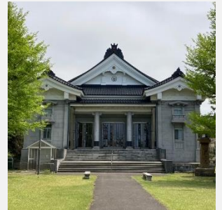
国登録有形文化財 浄福寺本堂を改修（柿崎区）

「上越市歴史的建造物等整備支援基金」に積み立て、歴史的建造物等の保存・活用の取組などに活用します。