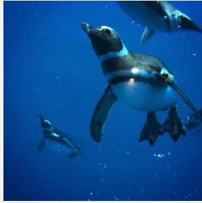
飼育数日本一！マゼランペンギン

「上越市立水族博物館整備運営基金」に積み立て、水族博物館うみがたりの展示内容の充実や将来的な施設改修、マゼランペンギンの保全活動の取組などに活用します。