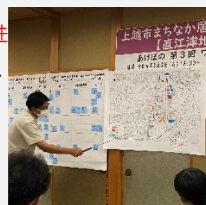
まちなか居住ワークショップ

使途の指定がない場合は、上記のほか、市の重点施策（まちなか居住推進事業、地域DX、脱炭素社会推進事業などに）に活用します。