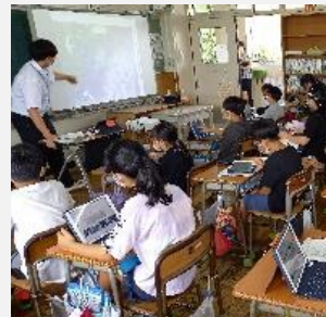
小学校の授業ではICT教材を活用

学校や図書館、公民館等で、児童書を中心とした図書の購入や、小中学校の教材充実のために活用します。