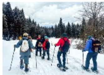
▲スノーシュートレッキング

中郷区に来てから初めての冬、朝になって雪で景色が一変する様子に驚きました。雪を使ったこの地域でしか出来ない行事も経験し、雪国暮らしの楽しさと厳しさの両面を知る1年でした。