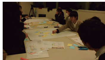
まとめ作成の様子