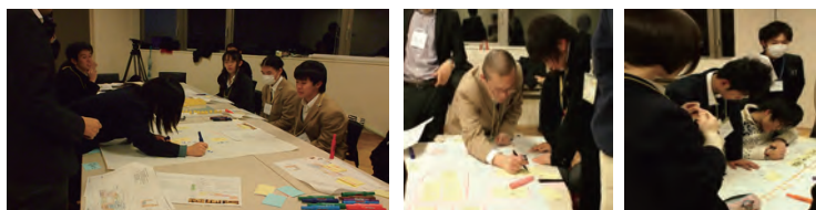
第2回ワークショップで検討した、新施設でやってみたいイベント