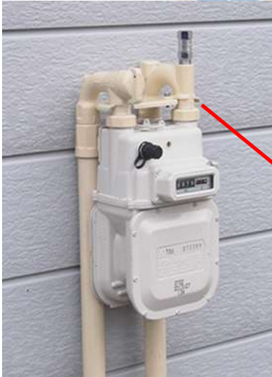
メータ廻りユニット