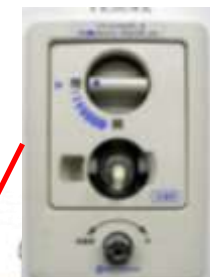
水道用コンセント