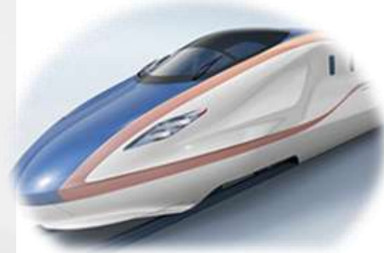
新幹線(ブレーキ装置など)などの車両用ボールバルブ