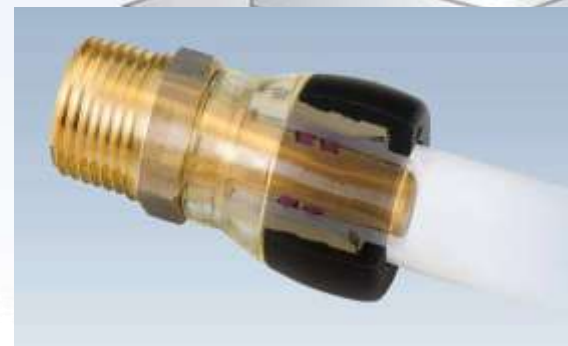
水道用樹脂管ワンタッチ継手