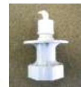
洗濯機用ニップル