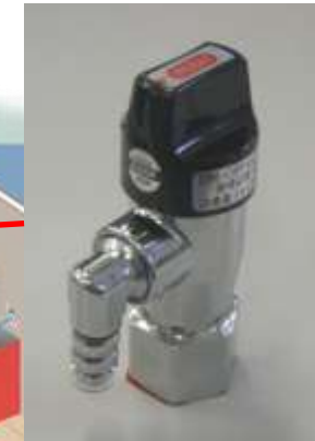
ON・OFFヒューズガス栓