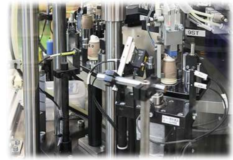
自動組立・検査機