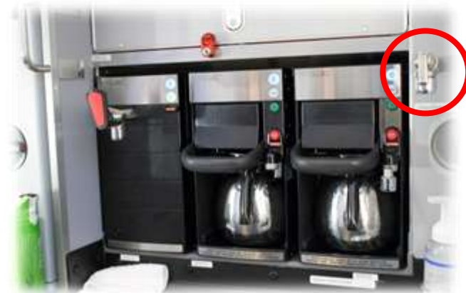
飛行機のギャレー(厨房)用フォーセット(水栓)