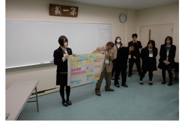
Aグループの発表の様子