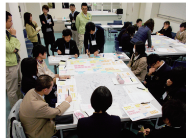
Aグループでの議論の様子

こちらのテーマでも音楽練習室や学習スペースに関する意見が多く出された。それ以外にも、複数の高校で連携し実施しているイベント「山カフェ」を新施設の調理室や飲食施設を活用して開催したいといった意見や、電車の待ち時間などに気軽に同世代の友達とコミュニケーションがとれるラウンジにしてほしいといった意見があった。初対面の生徒同士が同じテーブルを囲う形でワークショップであったが、どちらのグループでも終始和やかでありながら活発に議論が交わされた。次回以降も若い視点から、より良い施設とするための率直な意見を期待したい。