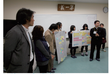
Bグループの発表の様子