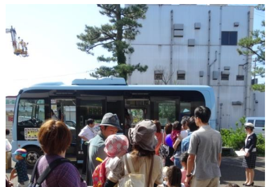
【バスの乗り方教室】