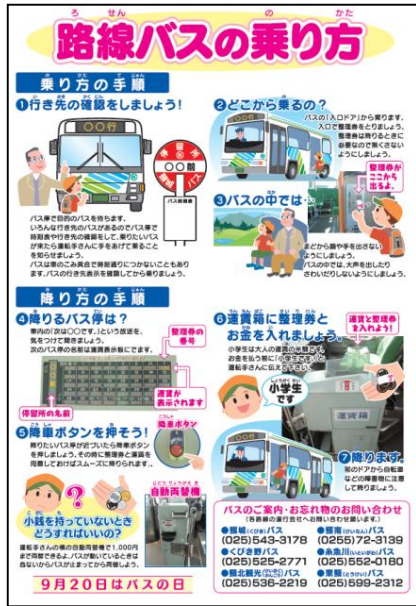
【表 路線バスの乗り方】

頸城自動車㈱がバスの日フェスタに使用する資料（路線バスの乗り方）の裏面に、利用促進に関する記事を提供する。