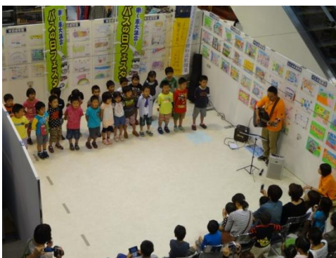
【園児による合唱披露】