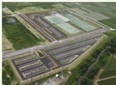
上越総合運動公園 (上越東部田園地域)