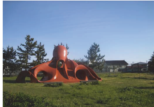
海浜公園(直江津周辺地域)