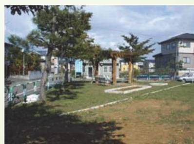
松の木公園 (直江津周辺地域)