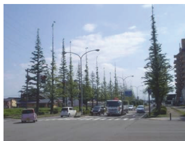
市役所周辺の街路樹 (春日山周辺地域)