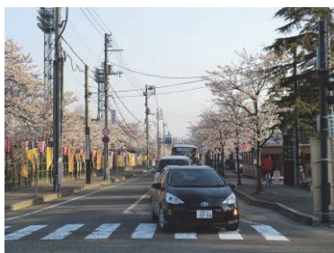
高田公園周辺の街路樹 (高田周辺地域)