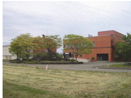
上越市下水道センター(春日山周辺地域)