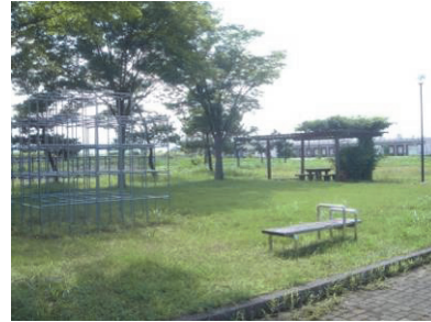
古川公園 (上越妙高駅周辺地域)