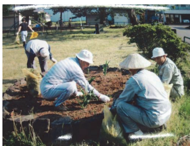
町内の維持管理活動 (高田周辺地域)

・身近な公園におけるパーク・パートナーシップ事業の積極的な活用を図り、地域住民との協働による維持管理を図ります。