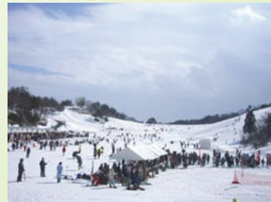
金谷山公園 (高田周辺地域)