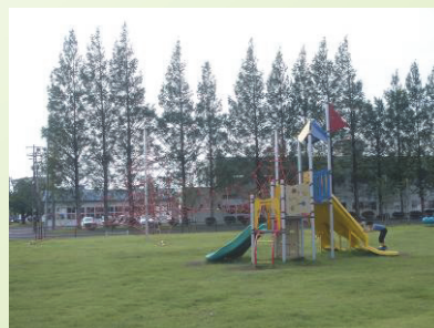
長楽寺公園 (春日山周辺地域)