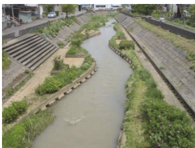
青田川河川環境整備による親水公園 (高田周辺地域)