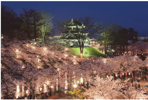
高田公園(高田周辺地域)