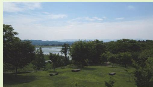
大潟県営都市公園 (大潟・頸城(西部)地域)