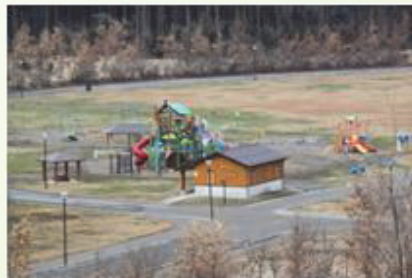
たにはま公園 (上越西部中山間地域)