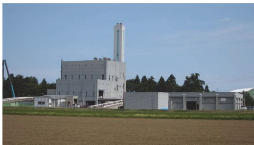
上越市クリーンセンター(上越東部田園地域)