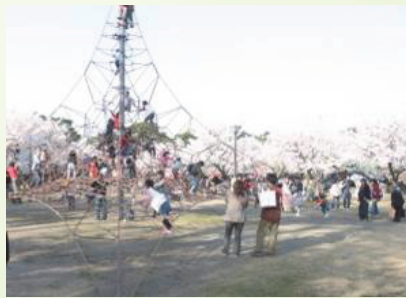
高田公園 (高田周辺地域)