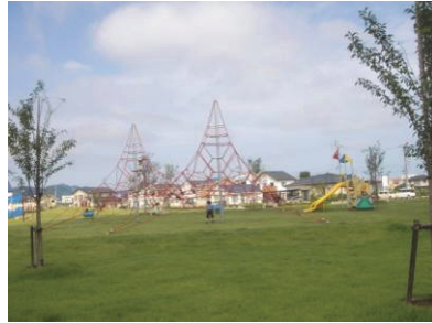
長楽寺公園 (春日山周辺地域)

・誰もが安心して利用しやすい、ユニバーサルデザイン*に配慮した都市公園*の整備・維持管理を進めます。