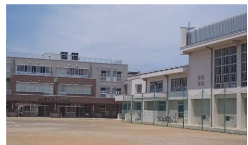
春日新田小学校(直江津周辺地域)