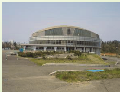
柿崎総合運動公園 (柿崎地域)