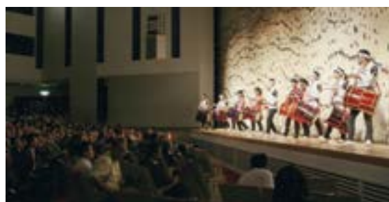
海音鼓(大潟区)によるオープニングアトラクション