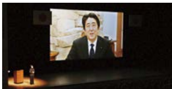
安倍首相ビデオメッセージ