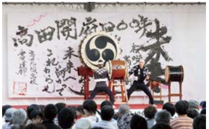
高田開府400年祭 城下町高田 わくわく“楽市” 201