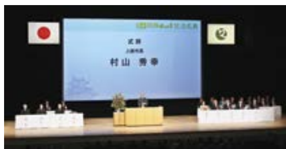
式辞(村山秀幸上越市長)