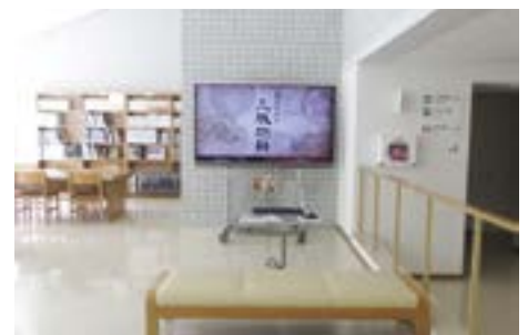
上越市立総合博物館での放映