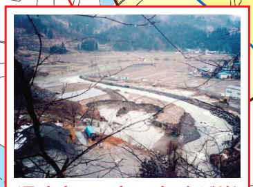
過去(H2.2)に土砂が崩落、保倉川に流入した