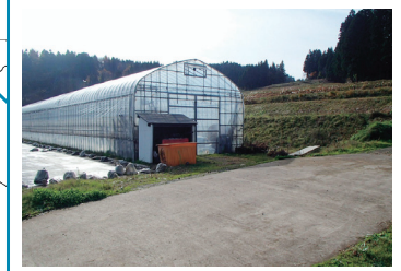
農業ビニールハウス 地震時一時集合場所 ※警戒区域内のため速やかに清里中学校へ避難が必要