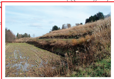
過去に地すべり発生