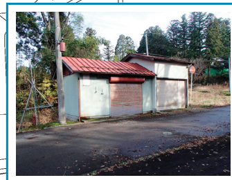
消防器具置場 土砂災害時一時集合場所 ※警戒区域内のため速やかに清里中学校へ避難が必要