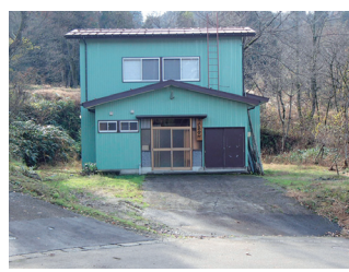
鶯澤集会場 大雨・地震時一時集合場所 ※警戒区域内のため速やかに清里中学校へ避難が必要