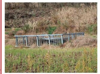
集水井戸 過去に地すべり発生