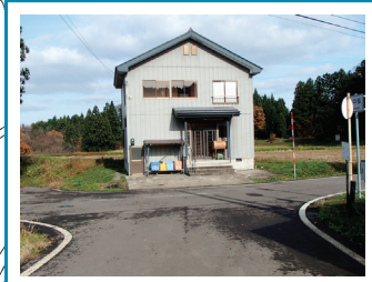
上中條公会堂 土砂災害時一時集合場所