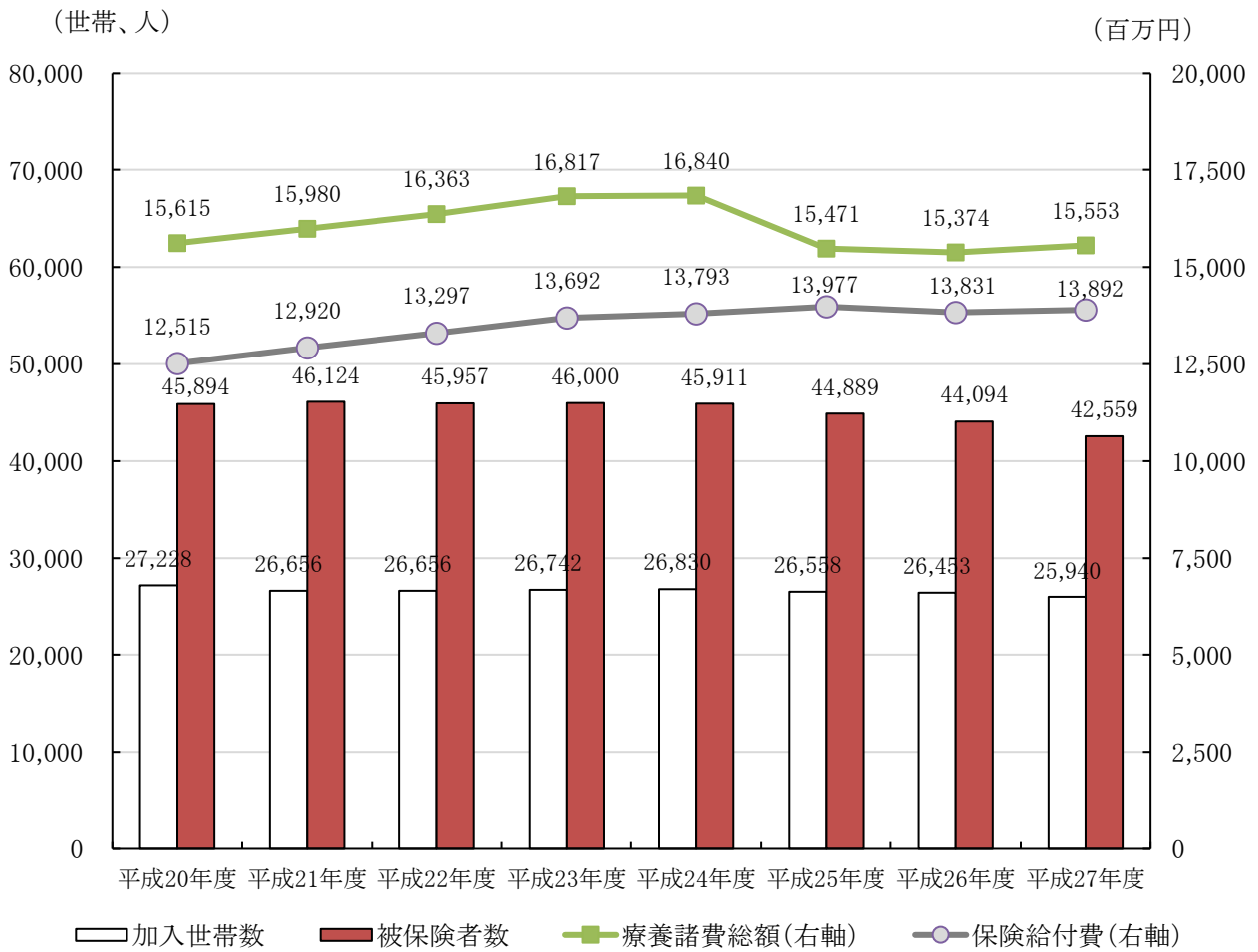
国民健康保険の加入世帯数等及び療養諸費・保険給付費の推移