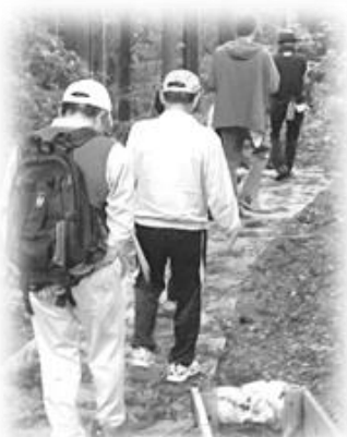
▲活動支援事業の現場をみる(古道整備)