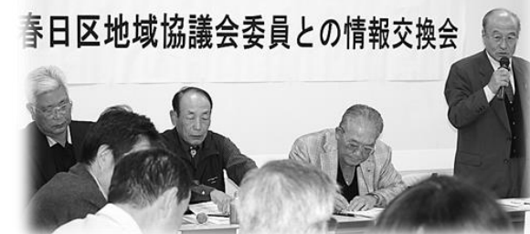
町内会長との情報交換会▲