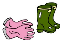
ゴム手袋、ゴム長靴