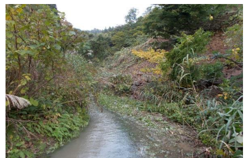
農業用用水の法面崩落(棚広地内)