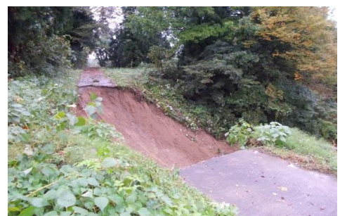
市道の崩落(神谷地内)