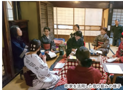
町家を活用した取り組みの様子

景観とまちづくりは切り離せないものだと思います。基本的には住人の日常と結びつくような景観(暮らし方の形)を、まちづくりとして考えたいと思います。そういう視点に立つと、「雁木」はわかりやすいですね。雁木の途切れたところに山なりの積雪があると、通学の小学生から、ゴミ出しに行くお年寄りまで、やむを得ず車道を歩かねばなりません。近隣の皆さんが除雪してくださることに感謝するとともに、そういうまちの『今とこれから』をどう考えていくか？見えない部分を考えて、それを発信して見えるようにすることは、景観まちづくりの重要な役割だと思います。住民がまちの良さを意識して、他者に語り伝えることで、当たり前だと思ってきたことが、実は大切なことであると自覚できます。言葉にすることで、まちに住む人の心が、来訪者にも一層強く伝わると考えます。