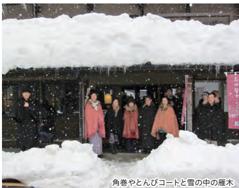
角巻やとんぼコートと雪の中の雁木

私は、元からあるものをいかに活かしていくかということを大事にしています。また、活かし方はそれぞれで異なってくるものですので、一朝一夕ではできません。経営している呉服店も約30年前に改装して、元々の町家を活かすように変えましたが、そのやり方が理解されるまで10年以上かかりました。今では少しずつ浸透してきているようで、近所では建具の取り換えや白蟻被害のための改修の際に、元々のまちなみを活かす形でどんな方法があるかを考えて、改修をしてくださいました。まずは自分たちからできることを始めることで、周りに気持ちが伝わって広がっていきたくらんだなと感じています。地道なことを続けていくことが景観まちづくりにつながっていくのだと思います。