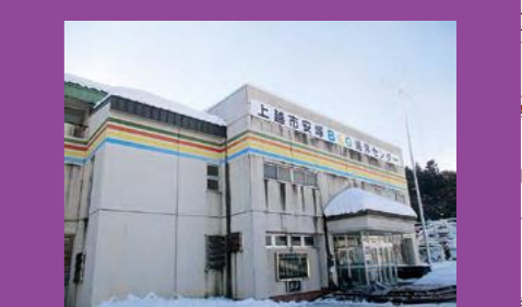
安塚B&G海洋センター ※避難所が警戒区域内であることから、避難時は2階フロアまたは体育館北西側を利用するよう注意が必要