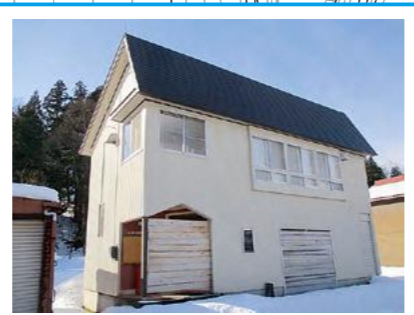
芹田地区集落開発センター ※芹田自治会が定めた一時集合場所 ※警戒区域内のため速やかに安塚B&G海洋センターへ避難が必要