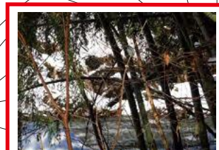
堤防が浸食されている