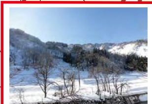
過去に崩れたことあり