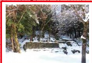
過去に土砂崩れ 現在も亀裂あり