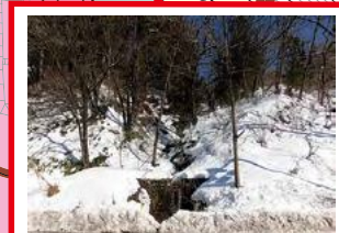
大雨の時、沢水で道路が 冠水するおそれあり