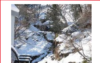
上流で崩れる箇所があり、 堰堤が機能しない可能性あり 土石流の発生により下流にある 家屋に被害が生じるおそれあり