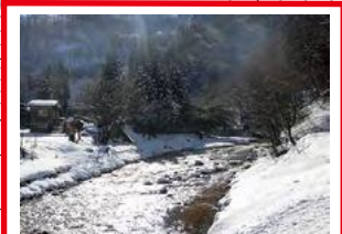
平成22年前後、 ひざくらいの高さまで 浸水した