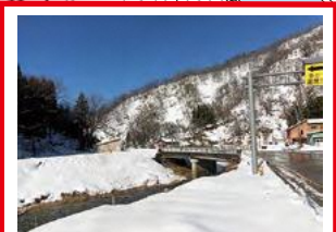
大雨の時、道路冠水 のおそれあり