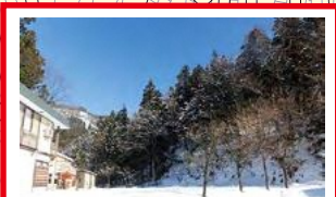
現在もすべっている より大きく崩れるおそれあり