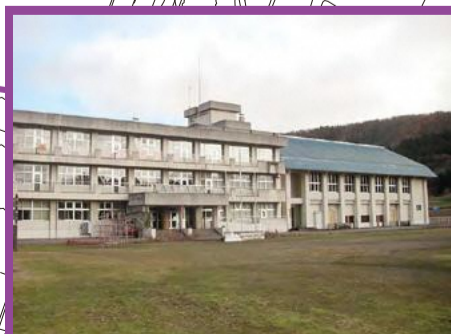
片貝地域生涯学習センター