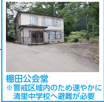
棚田公会堂 ※警戒区域内のため速やかに清里中学校へ避難が必要