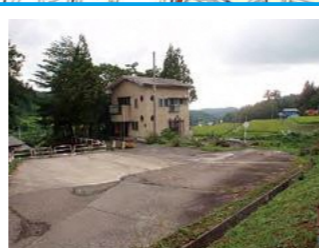
北野集落センター ※警戒区域内のため速やかに清里中学校へ避難が必要