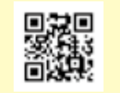
がん検診申込モバイル受付サイトQRコード