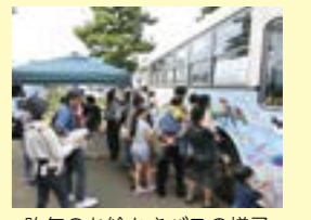
昨年のお絵かきバスの様子

9月20日は、日本で初めてバスが運行された「バスの日」です。この日にちなみ、路線バス（運転席で記念撮影ができます）やパトカーなどの展示、バスの車体へのぬり絵、園児が描いたバスの絵の展示などを行います。