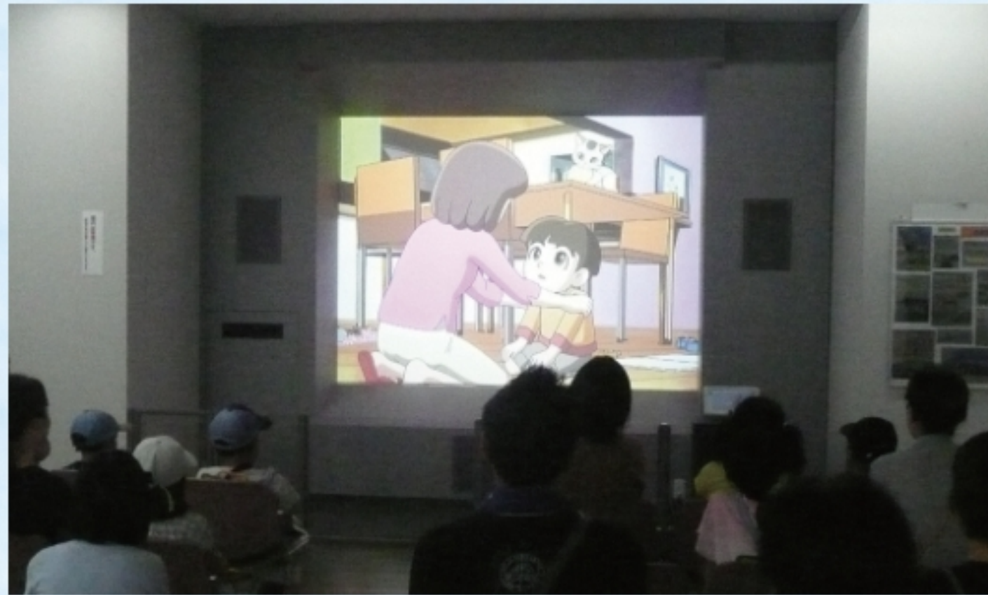
「じしんだ!! みーちゃんのぼうさいくんれん」を上映中。