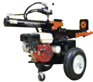
MS1700J エンジン式薪割り機

国内のユーザーの声を反映し、国産ならではの品質を追求した薪割り機です。従来の海外モデルに比べ、小型軽量化し、パワーやスピード、耐久性もアップしました。