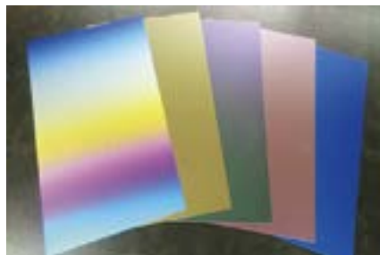
TranTixxi (トランティクシー)

軽量で耐久性の高いチタンの薄板に、表面仕上げを施した美しいチタン素材です。近代建築から和風建築、モニュメントなどさまざまな用途で使用できます。