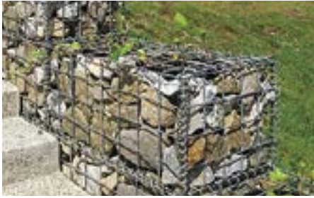
修景デザインフトンカゴ ディアシリーズ

箱状に加工した金網に石材などの自然素材を詰めるエクステリア製品です。金網に植物が絡み付くことで自然な風景を演出します。「うみがたり」などに設置されています。