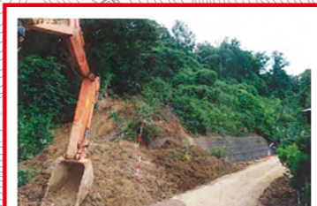
平成28年7月土砂崩れ発生