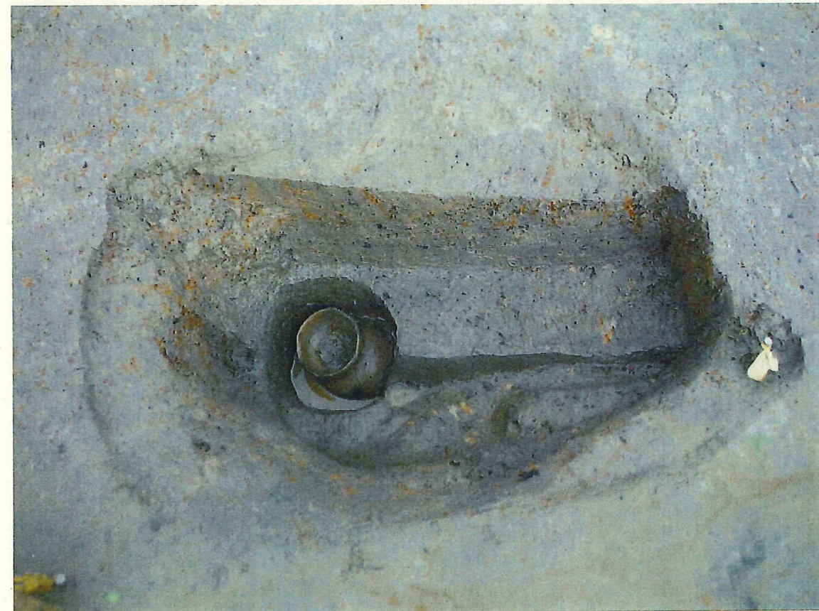
④ 2層 (柱痕埋土) を掘り下げた状況