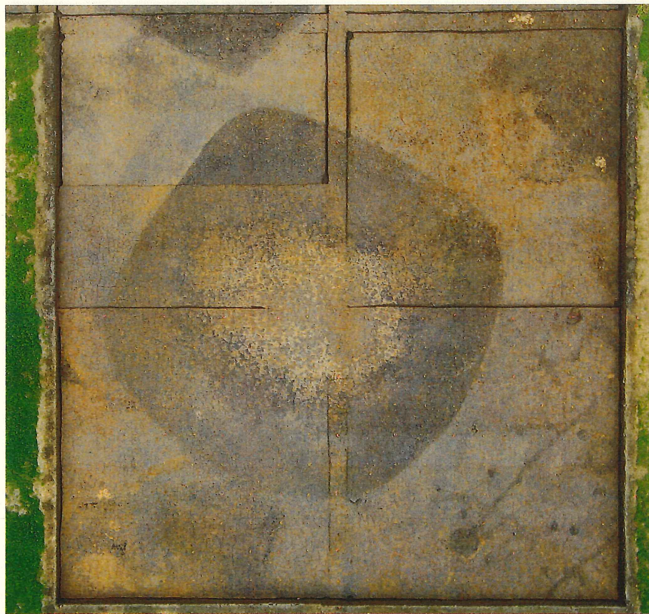
SI1568・SB1585 検出状況（上空から、平成30年6月撮影）