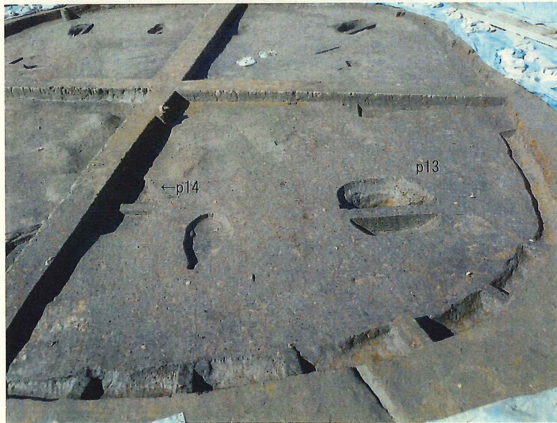
北東部 柱穴・壁溝の調査状況 (南東から)