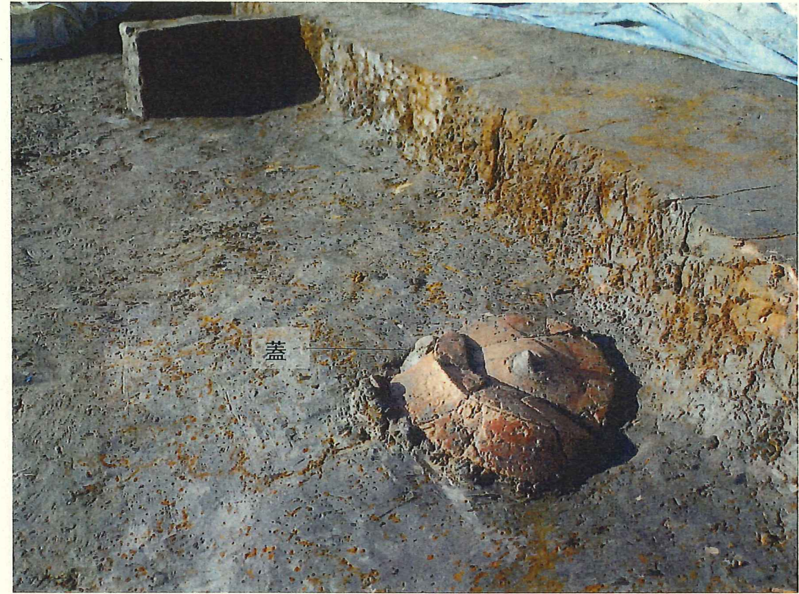
北東部 壁際 高坏・蓋出土状況 (南から) ※高坏の下から勾玉出土