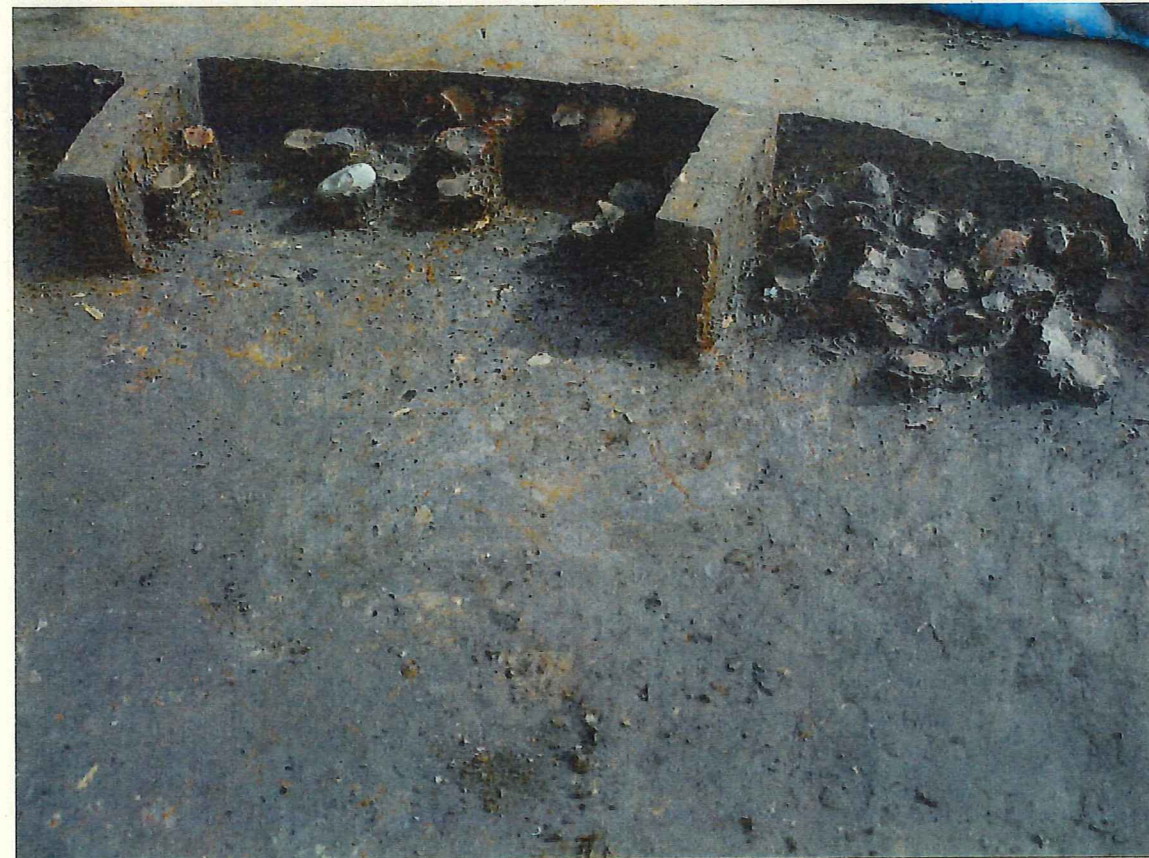
北東部 壁際 遺物出土状況 (西から)