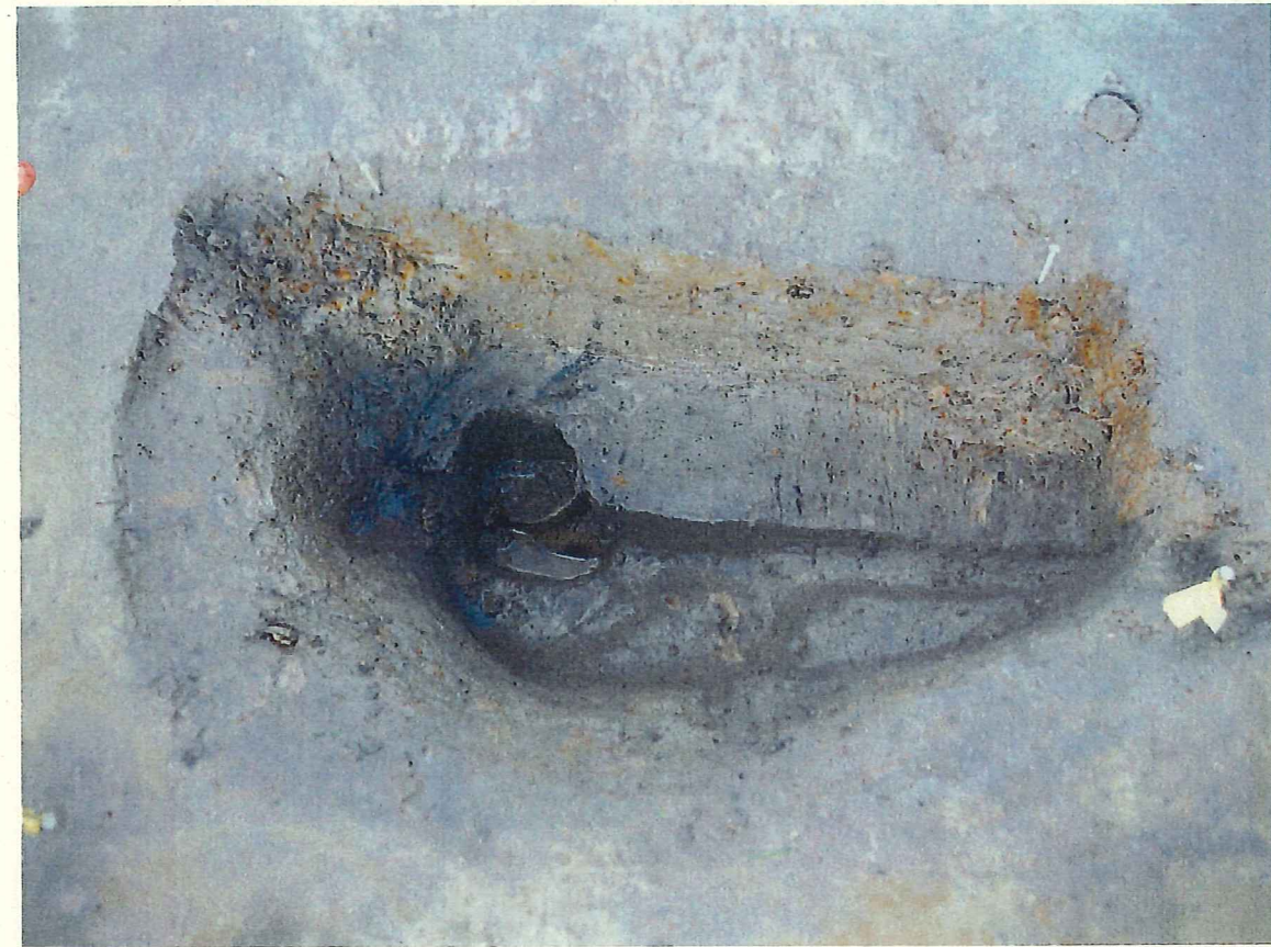
③ 1層 (暗灰色粘質土) を掘り下げて柱痕を確認