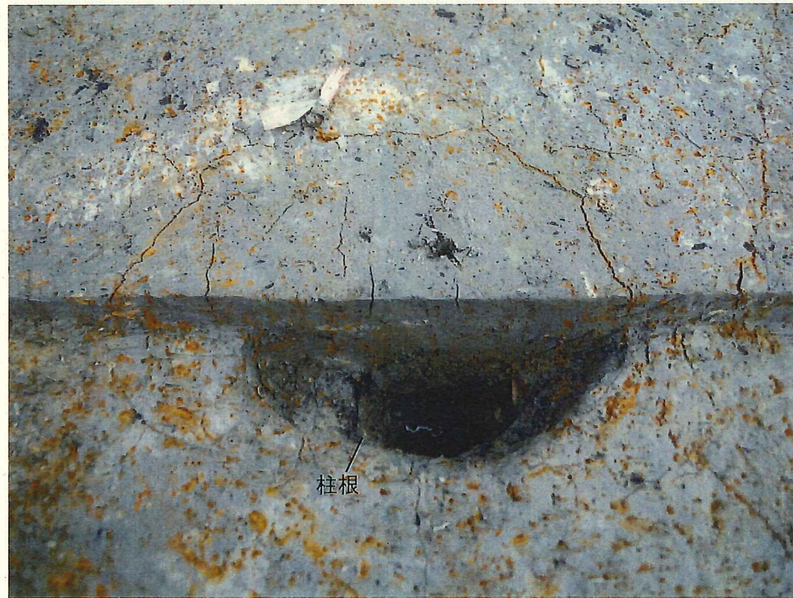
南西部 p4 土層堆積・柱根検出状況 (北西から)