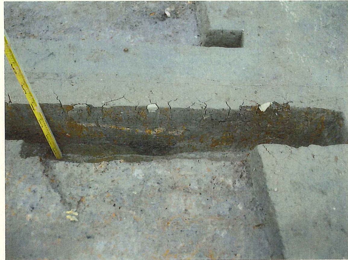
東西ベルト東側 壁際付近の土層堆積状況 (南西から)