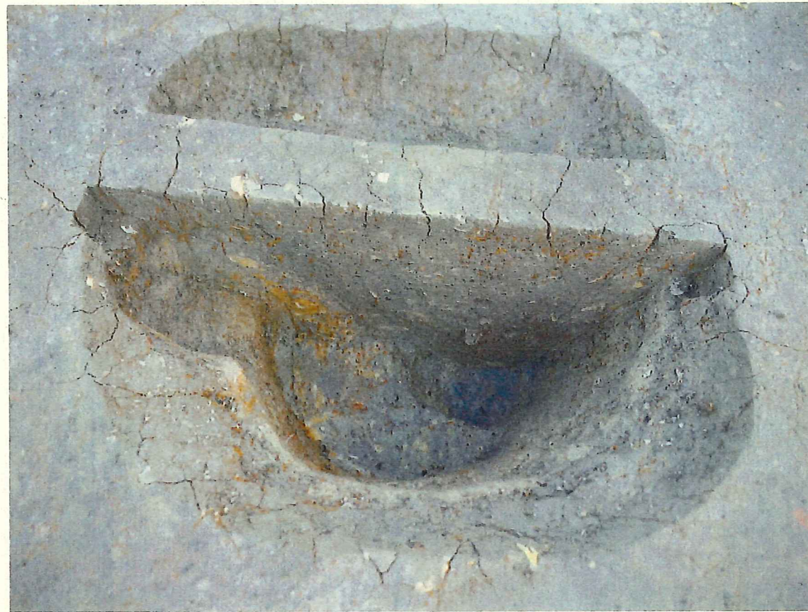
北東柱穴 (p13) 土層堆積状況 (北西から)