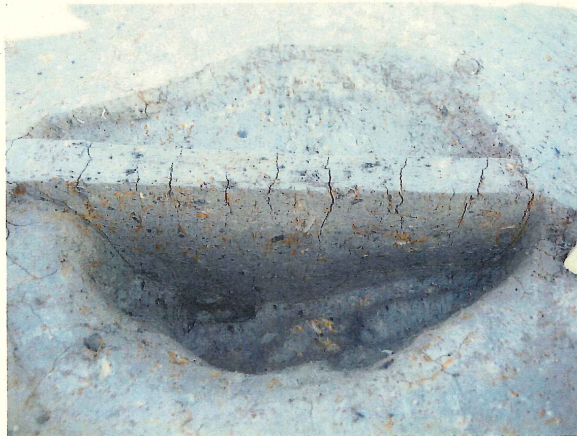
② 南半分を半截し、北半分は一段下げ (土器の一部を確認)