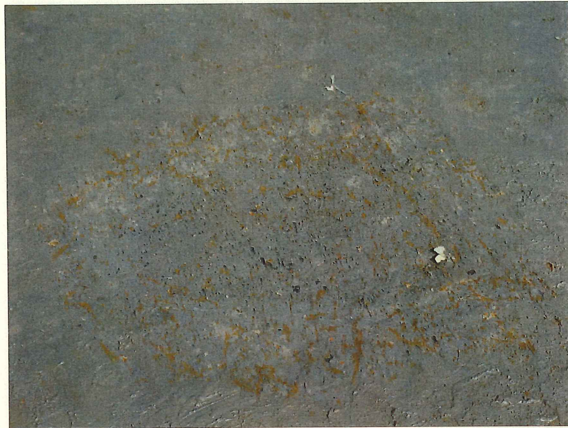
① 検出状況 (南西から)