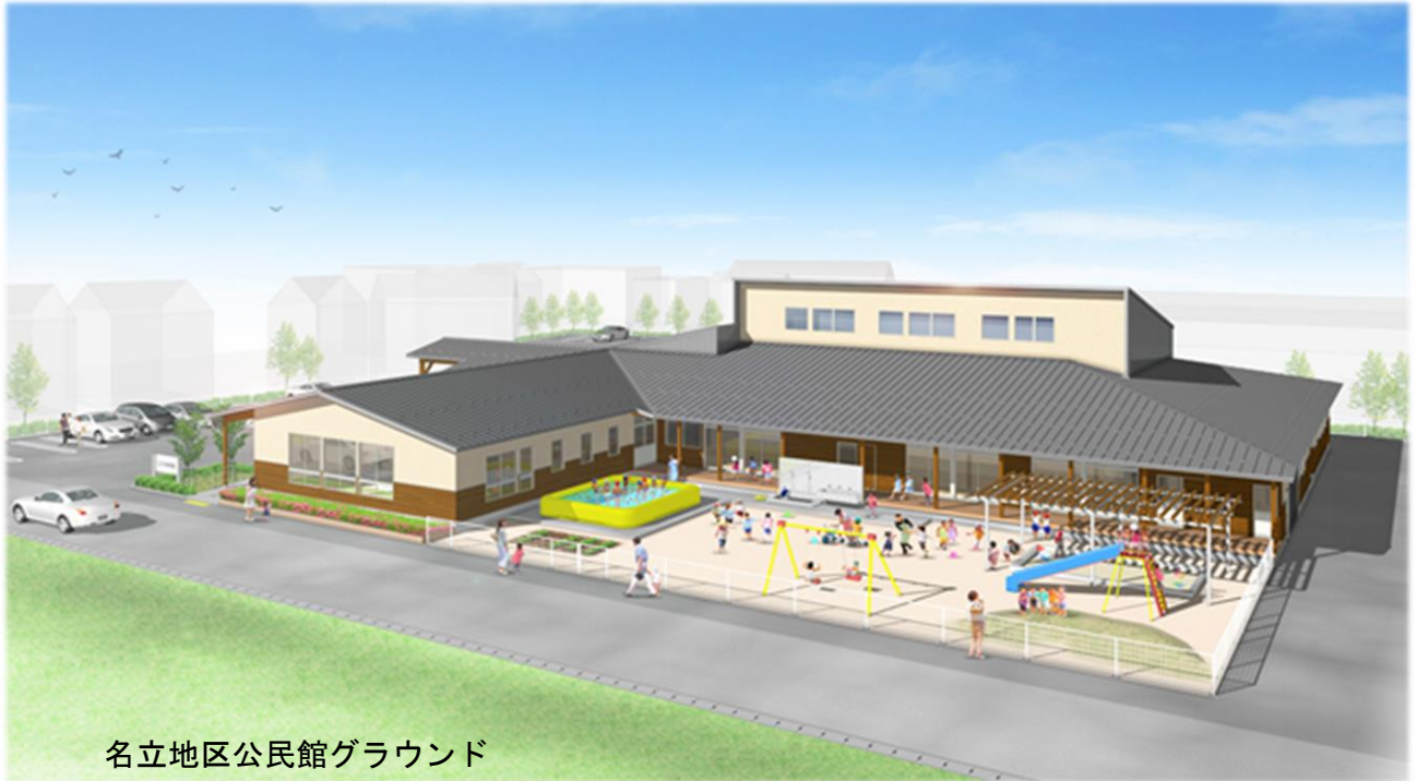
名立地区公民館グラウンド