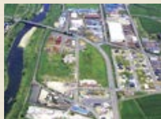
▲板倉北部工業団地