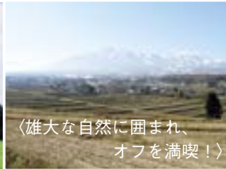
〈雄大な自然に囲まれ、オフを満喫!〉