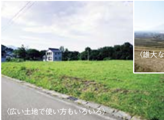
〈広い土地で使い方もいろいろ〉

越後富士といわれる妙高山に抱かれ、風薫る高原気分と趣味・スポーツが満喫できる環境です。春は山菜採り、夏はトレッキング、秋は紅葉、冬はウィンタースポーツと季節に応じた楽しみ方ができます。