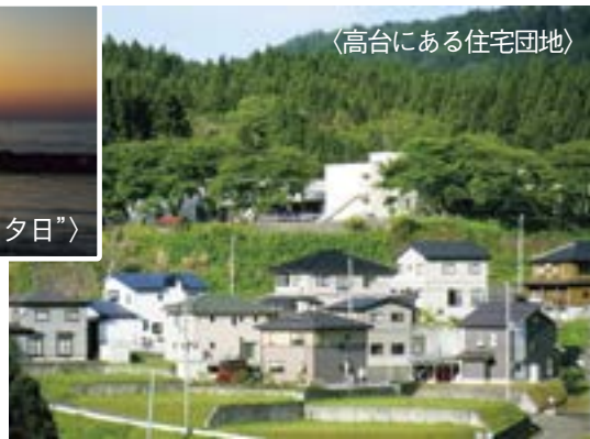
〈高台にある住宅団地〉