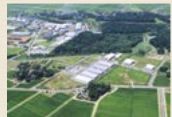
▲三和西部産業団地