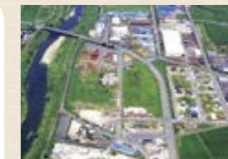
▲板倉北部工業団地