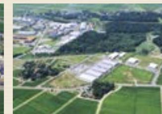
▲三和西部産業団地