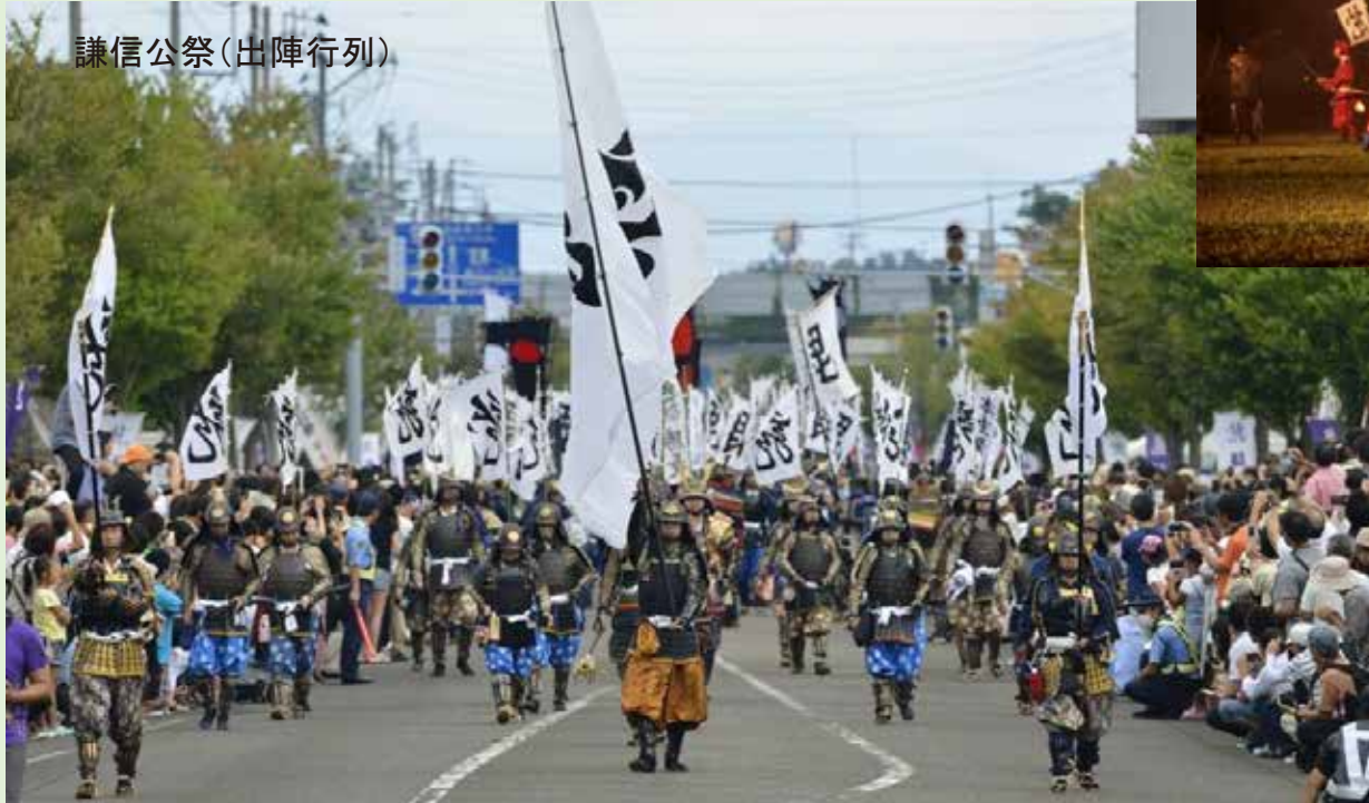
謙信公祭(出陣行列)