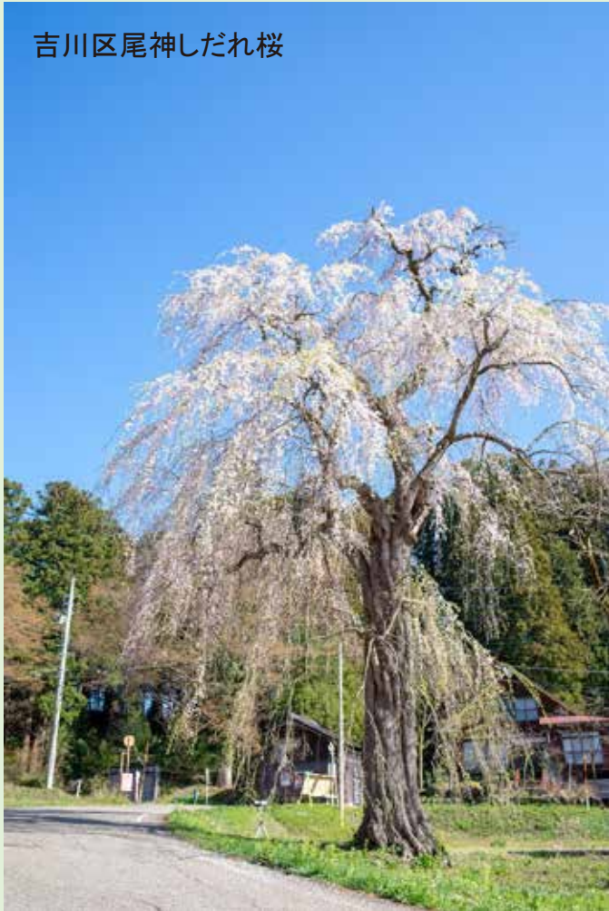
吉川区尾神しだれ桜