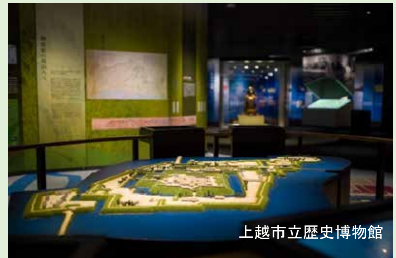
上越市立歴史博物館

2018年6月に上越市立水族博物館「うみがたり」がグランドオープンしました。 また、同年7月に上越市立歴史博物館がリニューアルオープンし、 市内に新たな魅力が増えました。