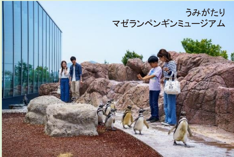
うみがたり マゼランペンギンミュージアム