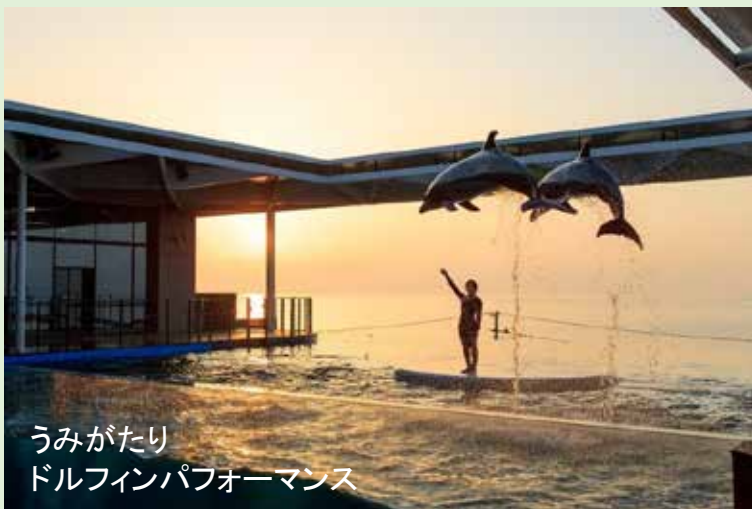
うみがたり ドルフィンパフォーマンス