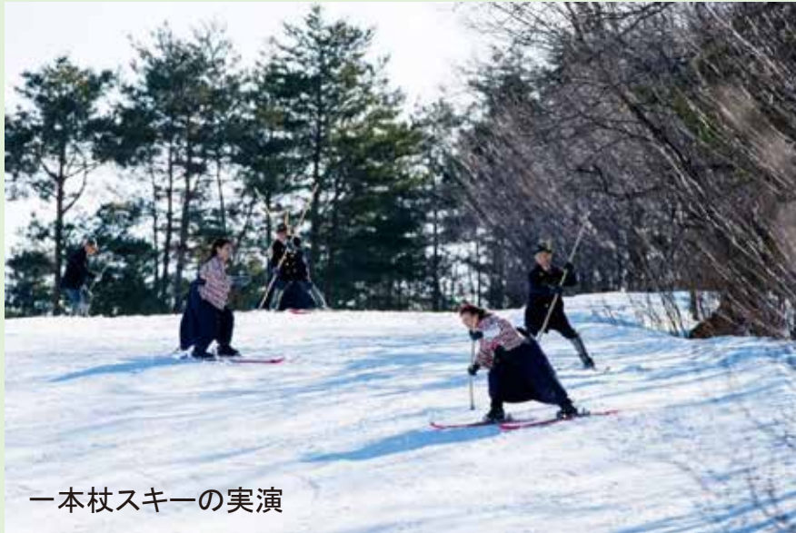
一本杖スキーの実演