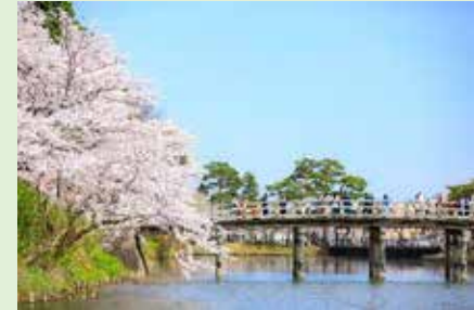
高田城百万人観桜会