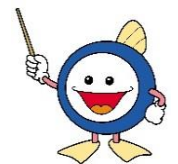
下水道マスコット キャラクター「スイスイ」

※下水道つなぎ込み工事は住宅リフォーム促進事業補助金の対象となりますので、ぜひご検討ください。