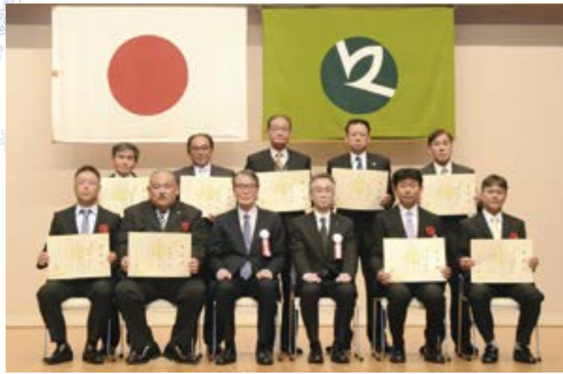
表彰された除雪功労者の皆さん