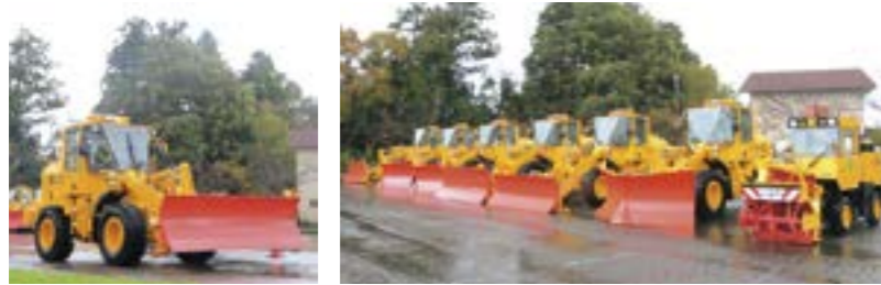
今年度購入した除雪車