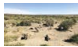
チュブ州が自然保護区として管理しているマゼランペンギンの世界最大の繁殖地「ブントンボ」

今後も引き続き、同州と交流を積み重ね、マゼランペンギンの保全に取り組んでいきます。