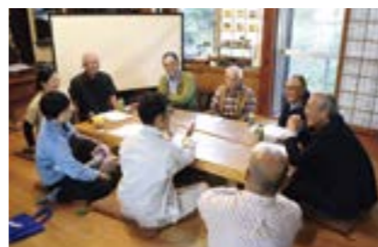
上越やまざと暮らし応援団

10月に、学生や子育て世代、市民団体と市長との市政に関する対話集会を開催しました。 上越公務員・情報ビジネス専門学校の生徒から「人口減少などにより、若者と高齢者が関わる機会が減っている。地域でのつながりを増やすためにはどうすればよいか」と質問があり、市長は「世代によって、気持ちや感覚が違う。人口減少が進む中でも、心豊かに暮らしていくため、その差を埋めていくことが重要」と話しました。