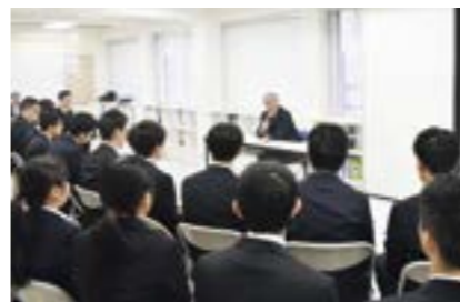
上越公務員・情報ビジネス専門学校