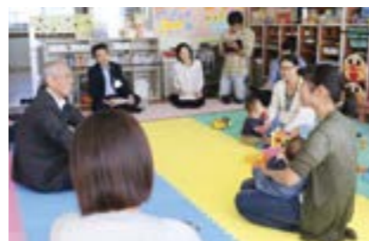
柿崎子育てひろば