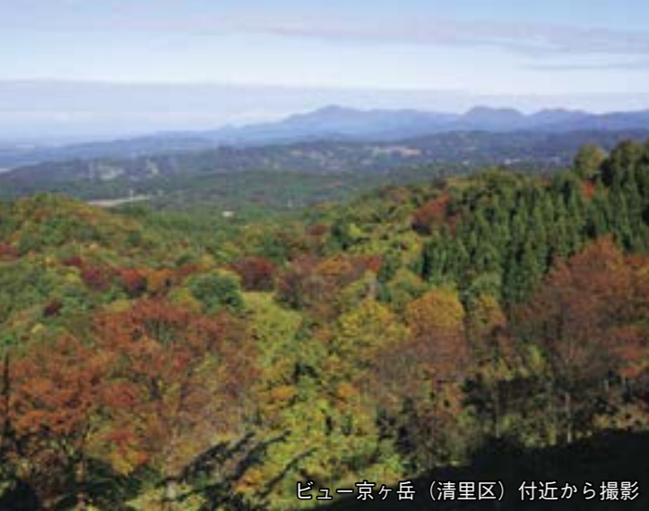
ビュー-京ヶ岳 (清里区) 付近から撮影