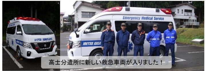
高士分遣所に新しい救急車両が入りました！